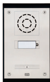
2N® Helios IP Uni

Seria 2N® Helios IP to produkty przeznaczone dla zastosowań w sektorze zabezpieczeń, bezpieczeństwa oraz integracji teleinformatycznych. Wideodomofony wykorzystywane są od najprostszych zastosowań z wykorzystaniem jednego telefonu IP, aż po duże sieci teleinformatyczne wykorzystujące zaawansowane systemy komunikacyjne. 2N® Helios IP posiada certyfikaty Cisco, Avaya, Broadsoft i jest szeroko stosowany w projektach wykorzystujących wyżej wymienione platformy telekomunikacyjne.