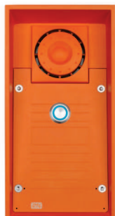
2N® Helios IP Safety