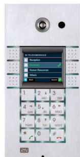
2N® Helios IP Vario