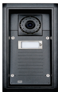
2N® Helios IP Force